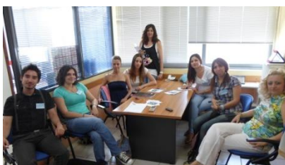
φωτο.: Στιγμιότυπο από τη συνάντηση εργασίας στο ΚΑΠΗ του Δήμου Αμαρουσίου

Η συνάντηση ολοκληρώθηκε με έναν αρχικό σχεδιασμό ως προς την εξειδίκευση των τομέων υπηρεσιών και της διαθέσιμης περιόδου απασχόλησης των εθελοντών.