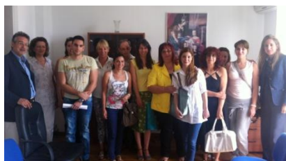
φωτο.: Στιγμιότυπο από τη συνάντηση των εκπροσώπων των δύο φορέων